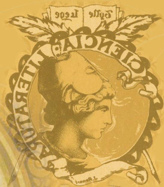
Ilustración de Javier Pérez Vicéns