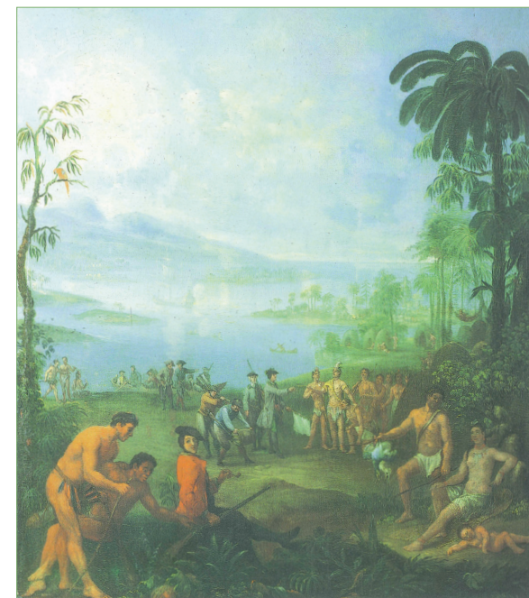
Européens débarquant en Amérique, début du XVIII e siècle - Huile sur bois, 58x65 - Collection privée